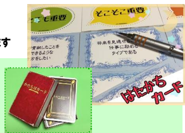
「はたかち」「かたちは」はJCCの登録商標です

【会場】 ピアザ淡海：203会議室 (滋賀県立県民交流センター) 琵琶湖が一望できる部屋で語り合しましょう！ 〒520-0801 滋賀県大津市におの浜1丁目1番20号 Tel: 077-527-3315 Fax: 077-527-3319 交通アクセス http://www.piazza-omi.jp/access/